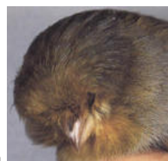
Crest-Bred - sem poupa