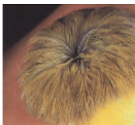
Crested - com poupa